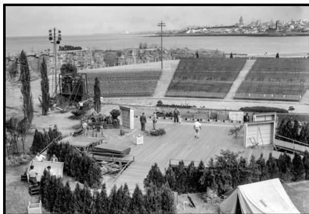
El Teatro de Verano durante su construcción.

Ramon Collazo es una emblemática figura del Carnaval, director, cantante, músico, fue una figura bastante importante que hizo del escenario del Teatro de Verano, su escenario predilecto en Uruguay a mediados del siglo XX. Posteriormente falleció a principios de los 80 y fue en 1986 que se decidió que el Teatro que anteriormente se llamaba Teatro Municipal de Verano, tome el nombre de: “Teatro de Verano Ramon Collazo” .