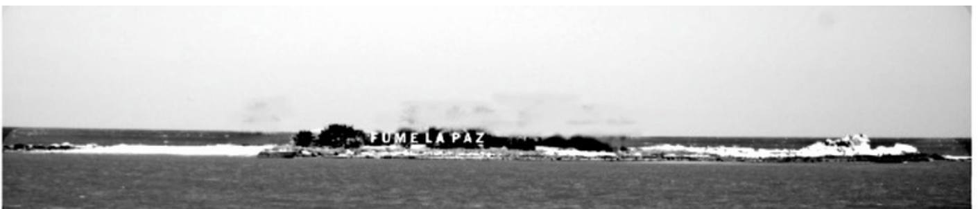
Reconstrucción aproximada de cómo se veía en su momento el cartel publicitario.

El tiempo reparo aquellos daños, pero el aumento de la polución entorno de la isla, fue alejando a muchos de sus naturales visitantes, lo que a pesar que ha mejorado la calidad del agua todavía no regresaron.