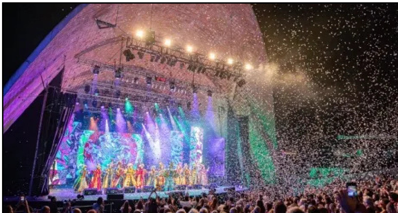
El Teatro de Verano en 2025