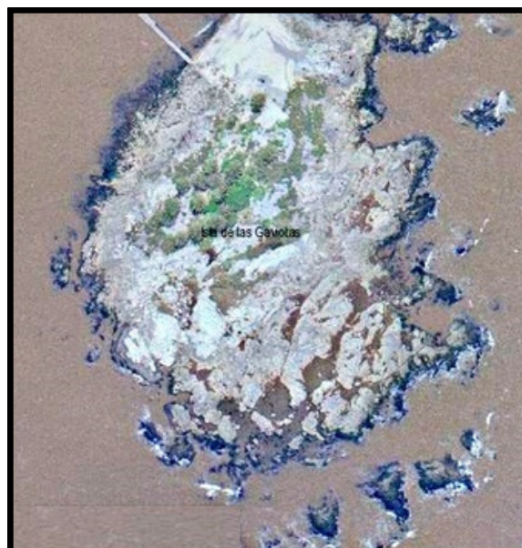
Vista aérea de la Isla en pleamar