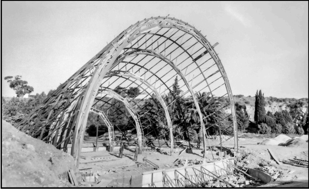
El Teatro de Verano en 1962.